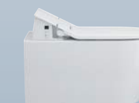
SensoWash® Slim — 22