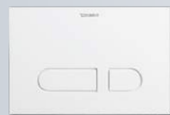
DuraSystem® — Betätigungsplatte A1 Kunststoff Weiß — Actuator plate A1 White plastic — Pulsador A1 Material sintético blanco # WD5001 011 000

Para todas las situaciones de instalación habituales se garantiza un montaje rápido, seguro y económico. Un pulsador de alta calidad convierte la tecnología en algo visual y tangible. Disponible para inodoros con pulsadores de lavado mecánico o electrónico, se integra de forma armónica en cualquier baño gracias a su aspecto atemporal y moderno.