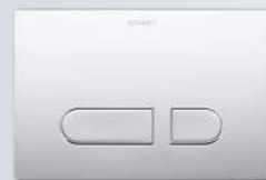
DuraSystem® — Betätigungsplatte A1 Kunststoff Chrom Hochglanz — Actuator plate A1 Plastic high-gloss chrome — Pulsador A1 Material sintético cromado brillante # WD5001 021 000