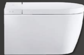
— SensoWash® Starck f Plus # 650000 — SensoWash® Starck f Lite # 650001

— Duravit y Philippe Starck presentan con SensoWash® Starck f una nueva generación de asientos de lavado para una higiene moderna y natural. Para ello, todos los componentes se han optimizado y toda la tecnología queda oculta en el interior del cuerpo de la cerámica. El asiento plano y el recubrimiento posterior en blanco forman una unidad armónica y precisa. Un asiento de lavado con tecnología de última generación aporta confort y un aspecto purista sin concesiones. Disponible en la versión SensoWash® Starck f Plus y SensoWash® Starck f Lite.