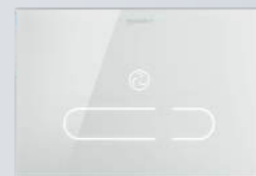
DuraSystem® — Betätigungsplatte A2 mit Infrarot-Näherungselektronik ESG-Glas Weiß — Actuator plate A2 with infrared proximity electronics White tempered safety glass — Pulsador A2 con electrónica de aproximación con infrarrojo Vidrio blanco ESG # WD5003 012 000