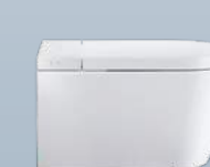
SensoWash® Starck f — 10

Naturalmente limpio y fresco. No hay una limpieza más a fondo, más higiénica, más natural y más refrescante que la realizada con agua. Incluso después de ir al baño. Por eso, el asiento de lavado, la síntesis de inodoro y bidé, resulta cada vez más popular. El agua brinda una placentera sensación de frescura y es más suave y más agradable que el papel higiénico. Así, tras usar el asiento de lavado, permanece en el usuario una sensación de limpieza y agradable vitalidad. Con SensoWash®, Duravit aporta un programa innovador y sofisticado de asientos de lavado que satisfacen las necesidades modernas de limpieza higiénica y elevado confort de manejo.